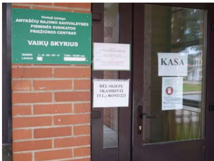
Anykščių pirminės sveikatos priežiūros centro Vaikų skyrius tapo koronaviruso židiniu.

Pirmadienį, lapkričio 23- iąją, Anykščių rajone koronavirusu iš viso sirgo 86 asmenys.