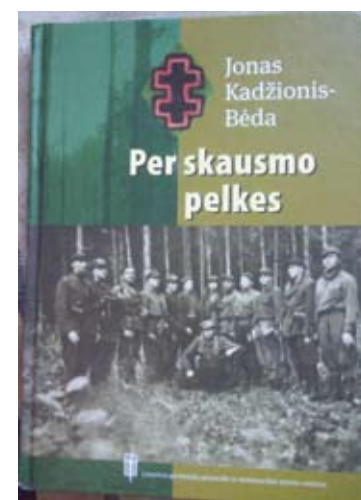
Dviejų šimtų puslapių knygoje sugulusi legendinio Aukštaitijos partizano gyvenimo istorija.