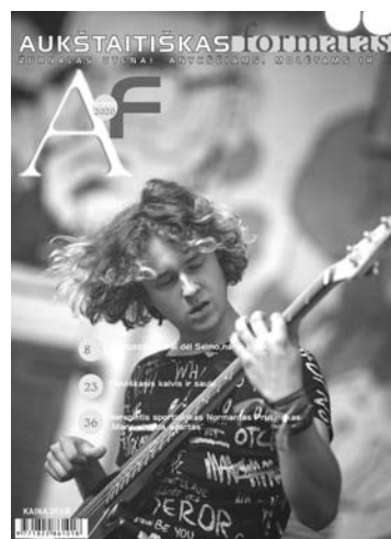
formatas“ prenumeruojamas visoje Lietuvoje.

Utenos regiono prekybos taškuose parduodamas žurnalas „Aukštaitiškas formatas“ plečia pardavimų geografiją. Nuo šiol žurnalą galima rasti ir visose Panevėžio bei Ukmergės „Iki“ parduotuvėse. „Aukštaitišku formatu“ prekiauja ir didžioji dalis Lietuvos rajonų centrinių paštu bei „Narvesen“ prekybos kioskai (Vilniuje: J.Lelevelio g. 2, Gynėjų g. 1, Gedimino pr.19, Sodų g. 24, Geležinkelio g. 16, Sodų g. 2; Kaune: Karaliaus Mindaugo pr. 49, Vytauto pr. 24; Šiauliuose: Aido g. 8, Tilžės g. 109; Klaipėdoje: Taikos pr.61 Taikos pr. 101; Palangoje: Vytauto g. 86). Žurnalas „Aukštaitiškas