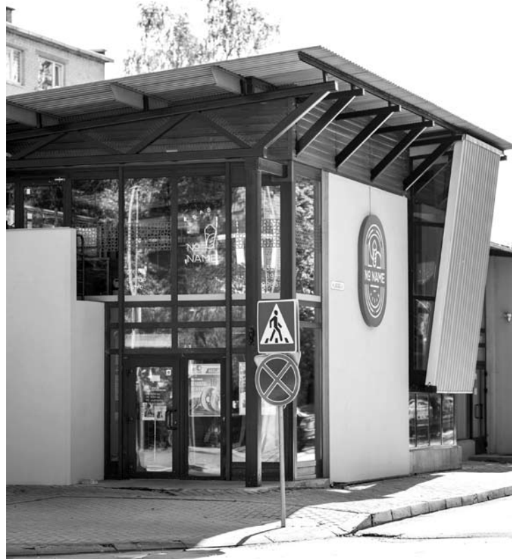
Greitojo maisto užkandinė „No name kebab“ šių metų spalį šventė pirmąjį gimtadienį.

Tuomet visi buvome prastose ir nedarbo. Sunkus buvo