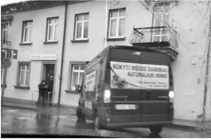
Sekmadienį autobusiuko nesuvaldžiusi girta moteris bandė susitarti su policijos pareigūnais jiems pasiūliusi kyšį.

Sekmadienį, lapkričio 22-ąją, 14 val. 37 min. autobusiukas pagrindinėje Anykščių miesto sankryžoje trenkėsi į stulpą. Įvykio vietoje dirbo policijos pareigūnai.